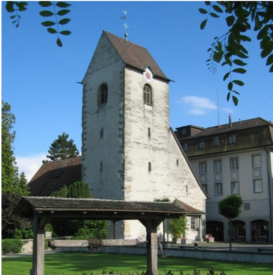
Alte Kirche mit Schloss im Hintergrund

Im Jahr 779 übergaben Waldrata, die Witwe des Zentralgrafen Waltram und ihr Sohn Waltbert den Ort «Rumanishorn» mit Kirche, Häusern, Weinbergen, Feldern, Obstgärten und einem Leibeigenen dem Kloster St. Gallen gegen einen jährlichen Zins.