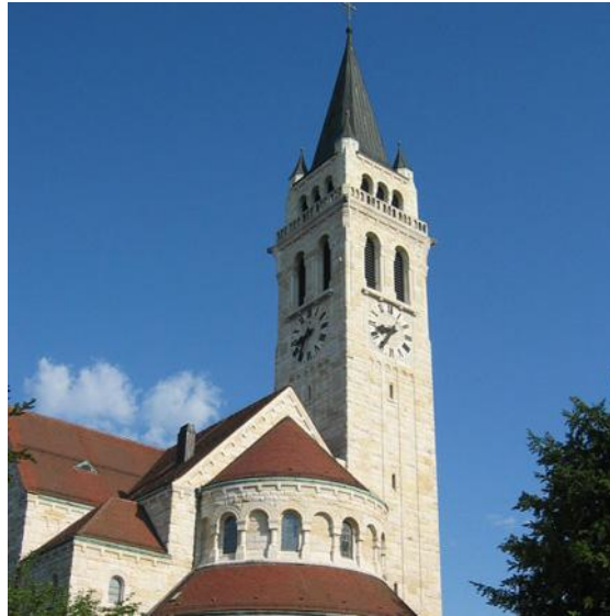
St. Johannes, Sicht vom Pfarramt aus

Romanshorn selber ist durch alle Jahrhunderte ein kleines Fischerdorf geblieben, bis im 19. Jahrhundert Bahn- und Schifffahrt einen ungeahnten Aufschwung brachten. Durch den Bau des neuen Hafens, die Eröffnung des Dampfboot- und Eisenbahnverkehrs wuchs die katholische Kirchengemeinde, so dass sich die Seelenzahl in 50 Jahren verzehnfachte und der Bau eines Gotteshauses in Angriff genommen wurde.