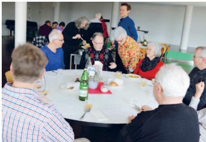
Suppentag vom 16./17. März jeweils nach den Gottesdiensten, welcher durch die Öko-/3.-Weltgruppe mitgestaltet wurde und unseren Fastenprojekts im Senegal von den Firmlingen vorgestellt wurde.

Für die Menschen im Bundesasylzentrum ohne Verfahren in Kreuzlingen, benötigen wir gut erhaltene Koffer (super wäre mit Rollen) und neuwertige Rucksäcke. Wenn Sie spenden möchten, einfach beim kath. Pfarramt abgeben. Herzlichen Dank!