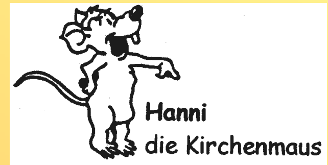
Hanni die Kirchenmaus

Und natürlich ist auch jede Mitarbeit herzlich willkommen! Das meint auch: